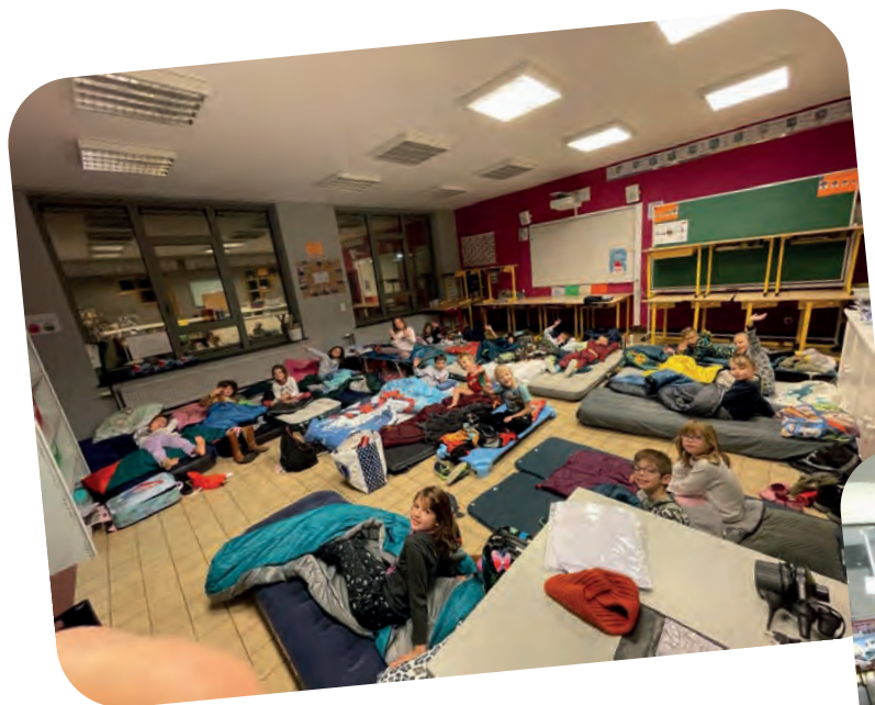
Les élèves de 5 e primaire de l'école communale de Rongy

Malheureusement chaque chose a une fin. Il est maintenant temps de tout ranger... Nous sommes ravis de cette nuit passée à l'école ! Quelle chance !